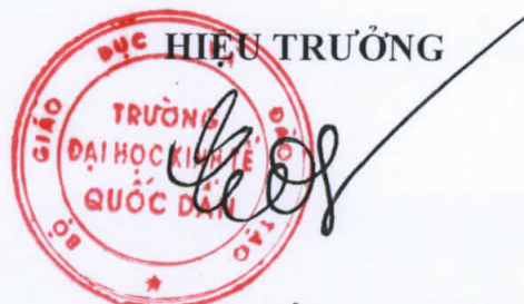
GS.TS Trần Thọ Đạt